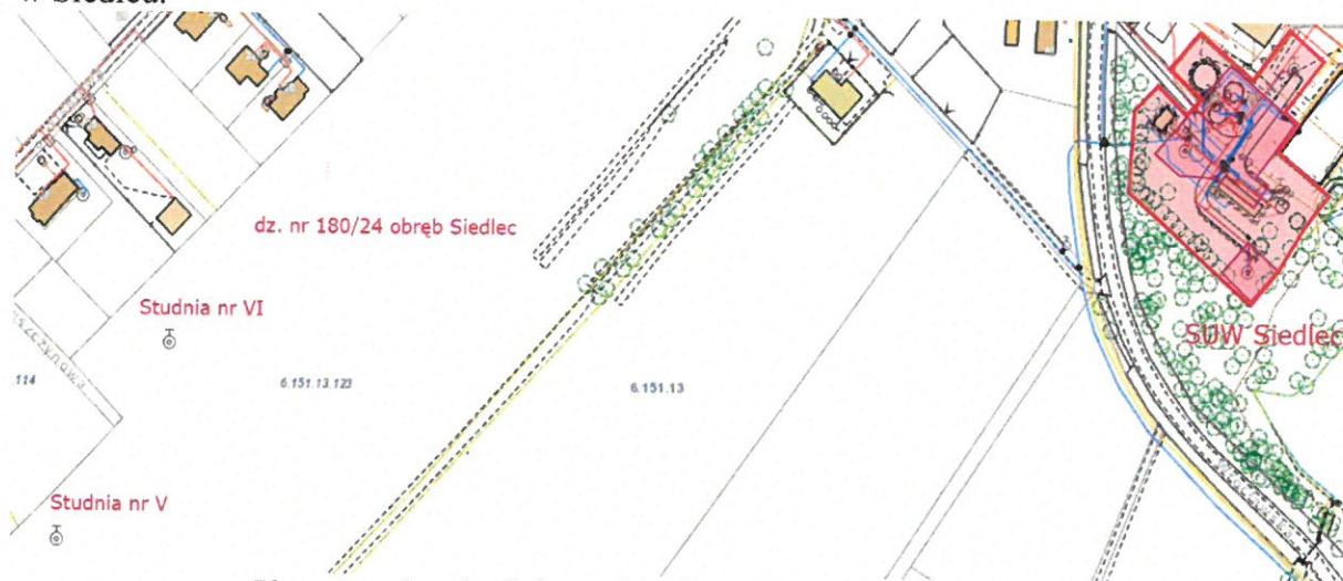
Plan sytuacyjny określający położenie studni V i VI oraz SUW Siedlec.