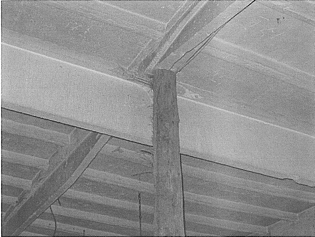
Fot .1 – Podparcie płatwi żelbetowej – miejsce zamontowania stoliczka wzmacniającego w osi 1 i przecięciu pomiędzy osiami C i D.