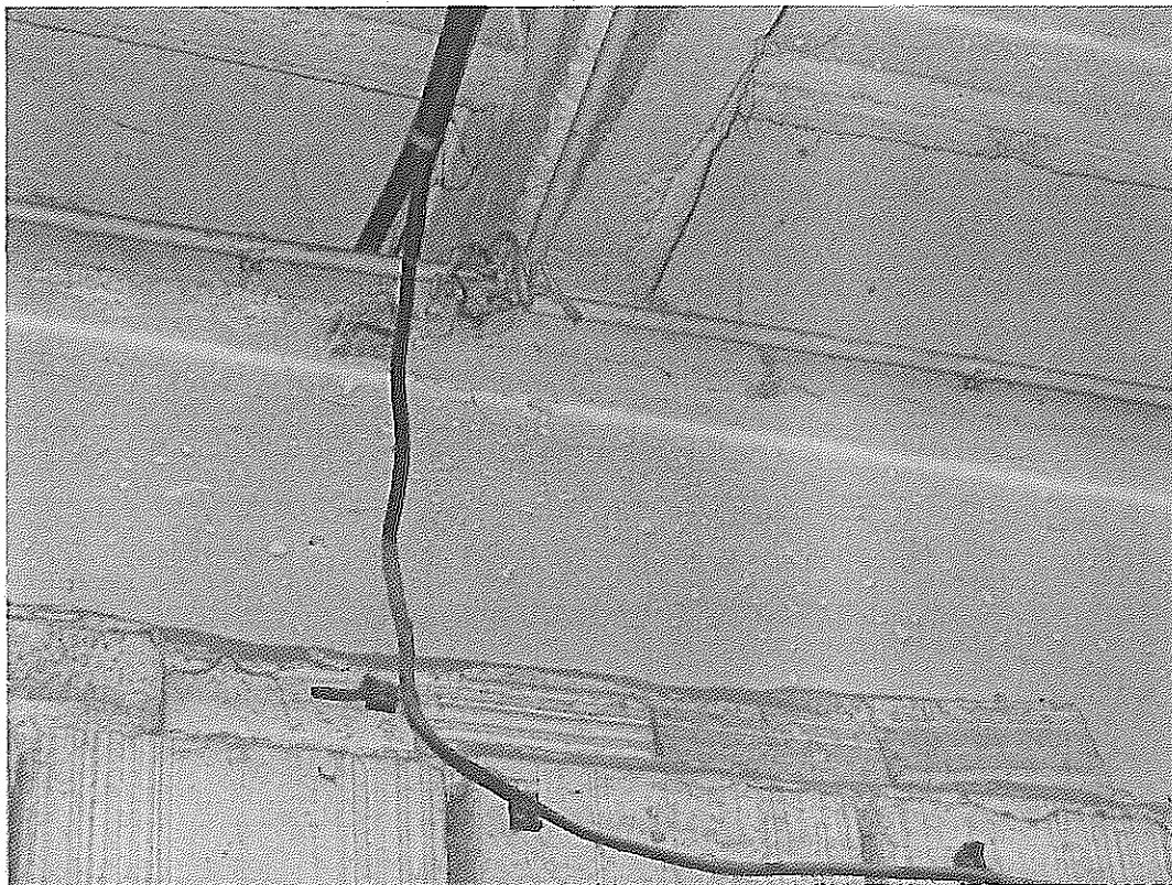
Fot .2 – Podparcie płatwi żelbetowej – miejsce zamontowania stoliczka wzmacniającego w osi 3 i przecięciu pomiędzy osiami A i B.